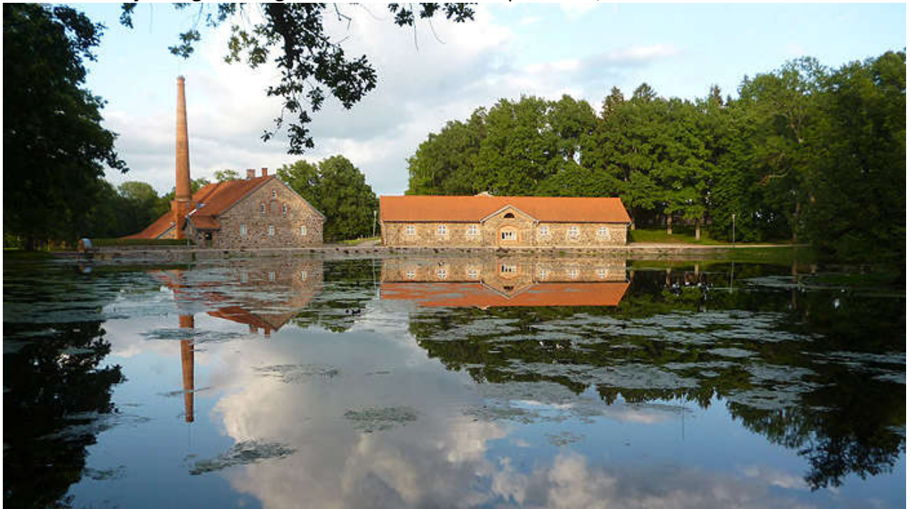
Olustvere park ja endine viinavabrik

Olustvere mõis ja park – Reegoldi – Paksu – Olustvere Jaamaküla juures – Olustvere park